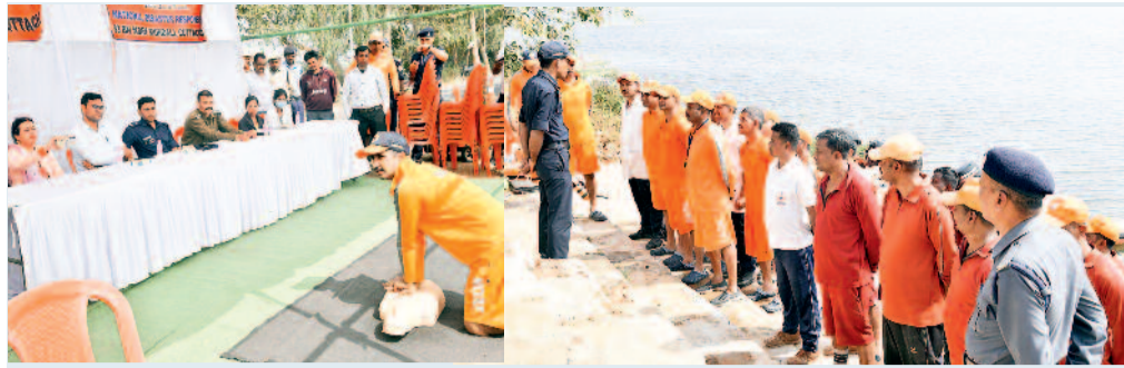
सागर का पूरा तट मोटर बोट्स की गर्जना से गूंज उठा। एक फंसे लोगों को बचाने की चुनौती सामने थी। पलक झपकते ही राष्ट्रीय आपदा मोचन बल के जवान हरकत में आए और

बस्तर की ऐतिहासिक धरोहर दलपत सागर की लहरों मंगलवार को केवल शांत खूबसूरती की गवाह नहीं थीं, बल्कि वे गवाह बनीं अदम्य साहस, प्रशासनिक मुस्तेदी और आपदा प्रबंधन की एक शानदार पाठशाला की। आगामी मानसून और बाढ़ की संभावित विभीषिका से निपटने के उद्देश्य से राष्ट्रीय आपदा मोचन बल, राज्य आपदा मोचन बल और नगर सेना ने एक संयुक्त अभ्यास को अंजाम दिया। इस पूर्वोक्त अभ्यास में न केवल प्रशासन की तैयारियों को परखा, बल्कि बस्तरवासियों को यह विषय भी दिलाया कि संकट के समय देसी तकनीक और सूझबूझ का सही तालमेल कैसे जीवन रक्षक बन सकता है। अभ्यास की शुरुआत होते ही दलपत